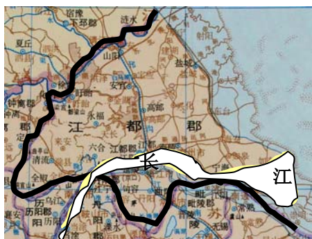
图 2 隋江都

3 看图 2、图 3 说明隋代江都郡、明代南直隶突出 体现了哪一种中国古代行政区划原则？（10分）