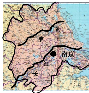
图 3 明南直隶